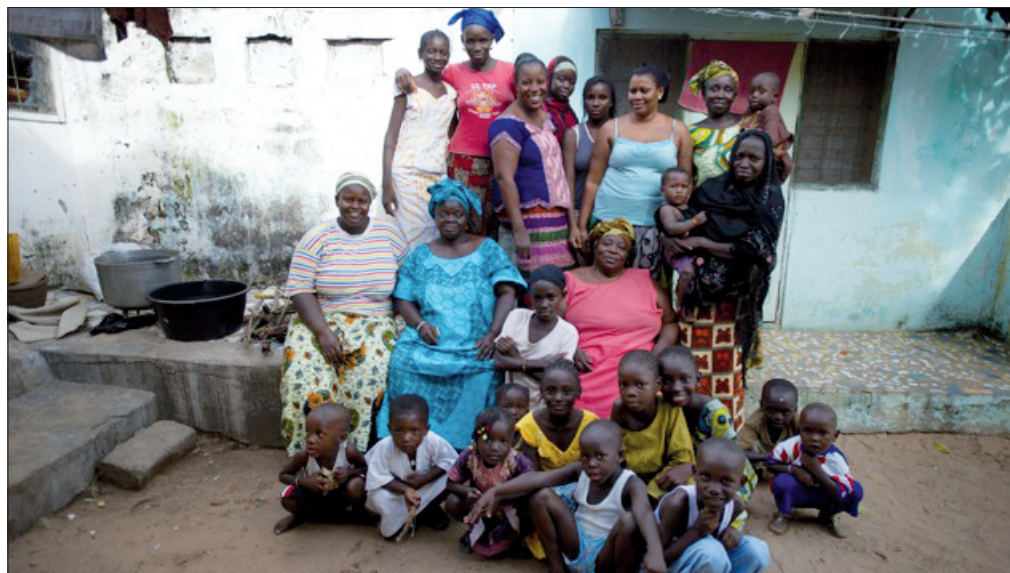
Développer de nouvelles perspectives dans le pays d'origine